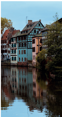
Region (nach PLZ)