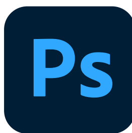
Photoshop-Vorlage Allgemeinstelle (6/1)